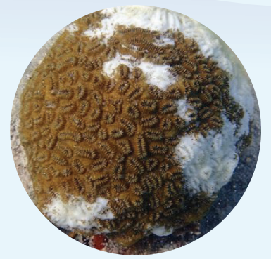
Corales Duros Enfermos

Foto izquierda: K. Marks, derecha: A. Bruckner