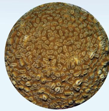
Corales Duros Saludables